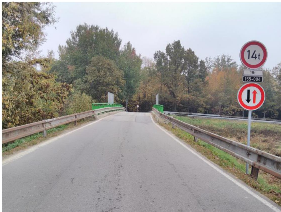
Obrázek 2 Aktuální stav řešeného úseku komunikace II/155 – prostorové uspořádání na mostě, pohled ve směru staničení