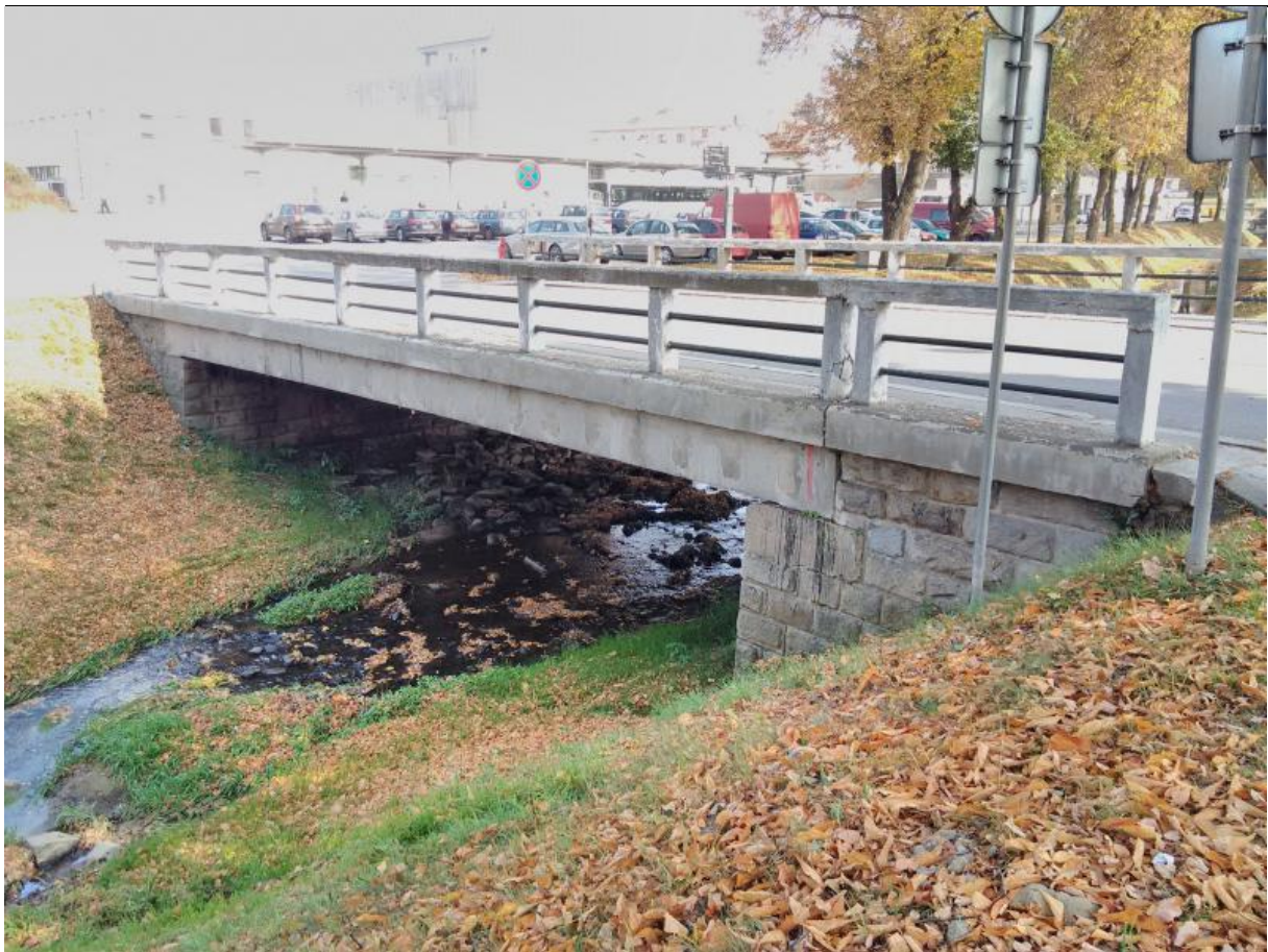
Obrázek 2 Boční pohled na most ev.č.157-012