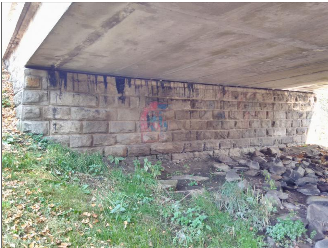
Obrázek 3 Čelní pohled na podpěru