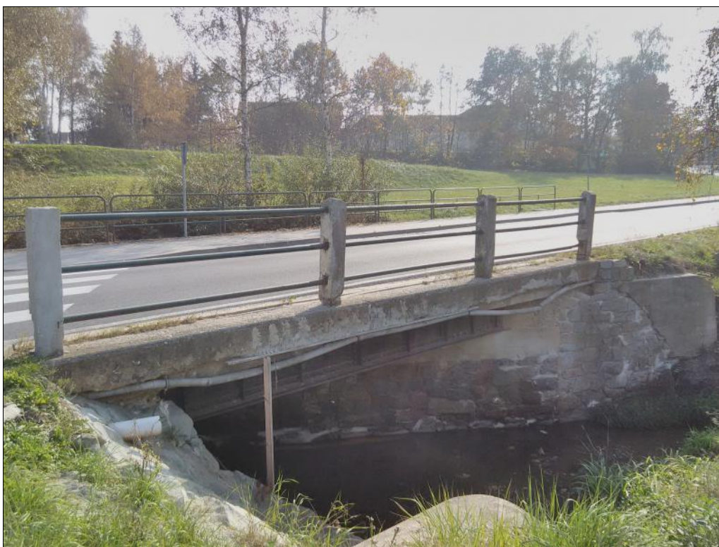
Obrázek 4 Boční pohled na celý most ev. č. 157-013 z levé strany