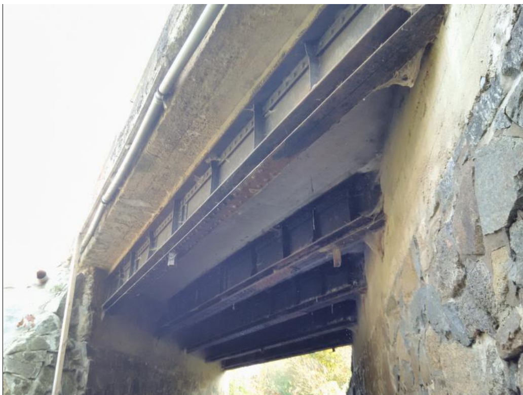
Obrázek 5 Pohled na nosné konstrukce