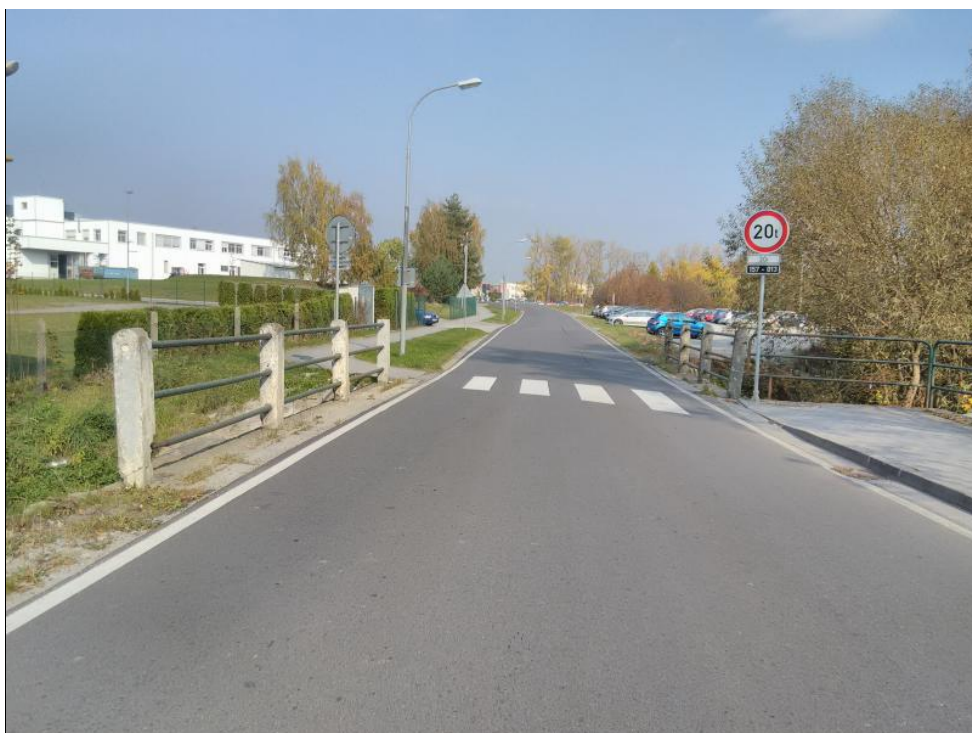
Obrázek 3 Prostorové uspořádání na mostě ev. č. 157-013