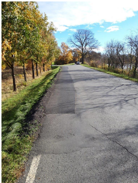
Obrázek 3 Aktuální stav řešeného úseku komunikace II/141